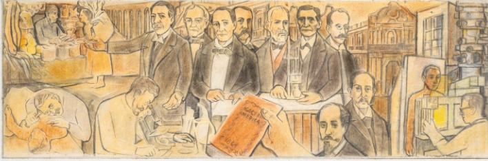
PROYECTO DE MURAL ACADEMIA MEXICANA DE MEDICINA